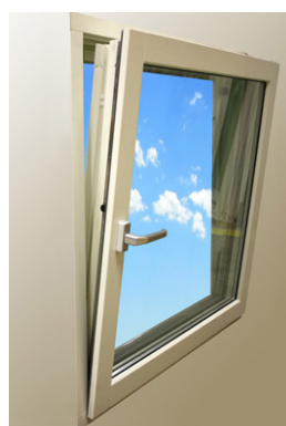
3. Vädringsläge (Kipp)