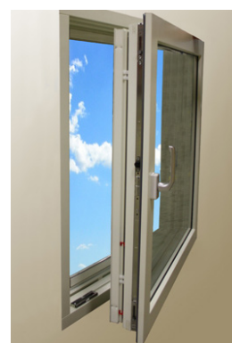
4. Öppet läge (Dreh)