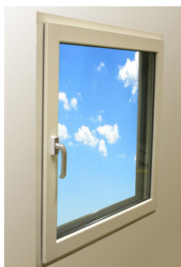
1. Stängt läge